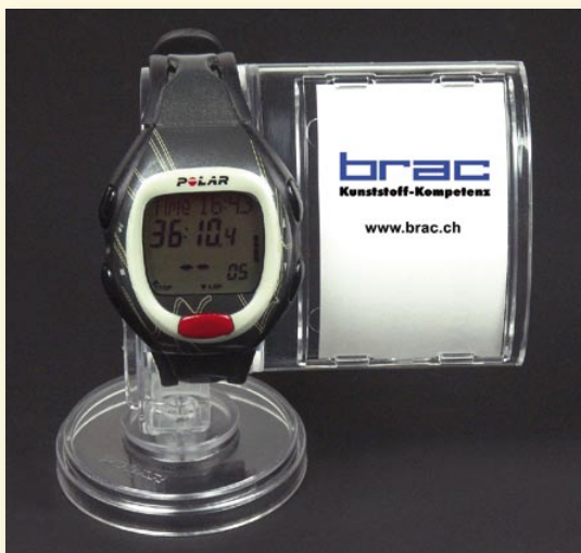
Transparenter Uhrenhalter mit Platz für Details und Preisauszeichnung