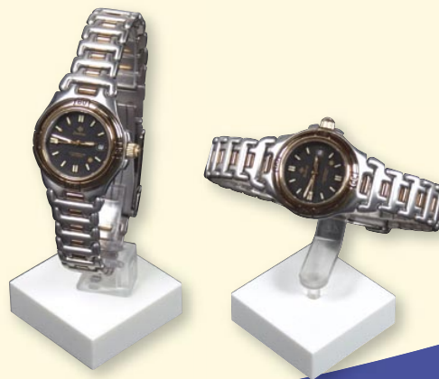
Uhrenhalter in allen Formen und Grössen

Grosse Erfahrung, computergestütztes Design, handwerkliche Präzision, modernste Fertigungstechnologien und -anlagen bilden die Grundlage, um höchsten Anforderungen gerecht zu werden. Das Ergebnis sind Lösungen die ein Licht- und Farbenspiel an den Point of Sale und in das Schaufenster zaubern.