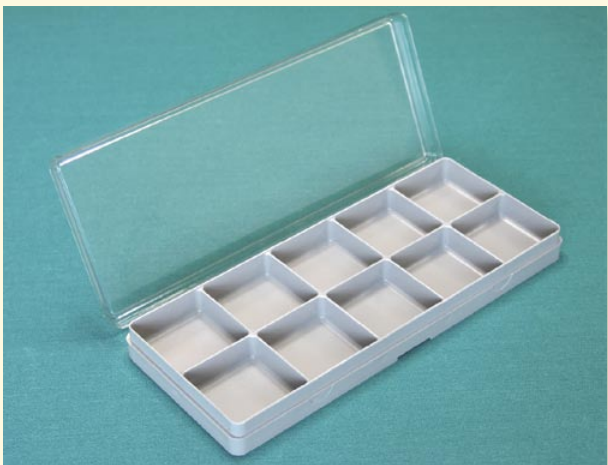
10-Fach-Verpackung mit Scharnierdeckel aus unserem breiten Standardsortiment