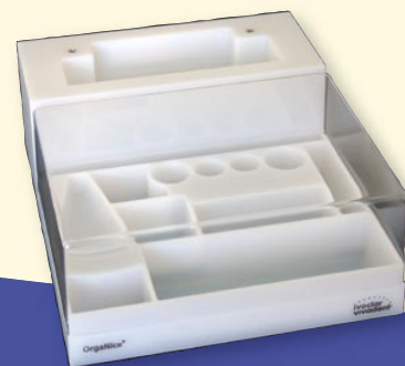
Organizer für den Dentalbereich

Die Zertifizierung SQS gibt die Gewähr, dass die hohen selbstaufgelegten Qualitätsansprüche eingehalten werden.