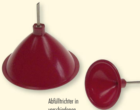
Abfülltrichter in verschiedenen Größen

Unsere Lösungen lassen sich u.a. in der Chirurgie, Orthopädie, Rehabilitation und im Kosmetikbereich finden.