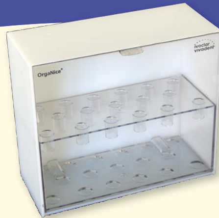
Organizer für den Dentalbereich