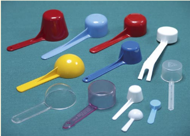
Wir bieten eines der grössten Sortimente an Masslöffeln aller Art und Grösse