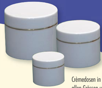
Crèmedosen in allen Grössen und Ausführungen

Auch für kundenspezifische Verpackungs- und Dispenserlösungen sind wir Spezialist.