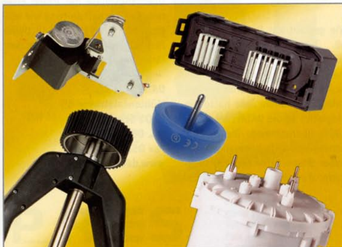
Präzisionskombinationen für die verschiedensten Bereiche.

stoffe auch die Herstellung von Kunststoff-Metall- und Kunststoff-Keramik-Kombinationen zum Kerngeschäft. Benötigte Stanz-