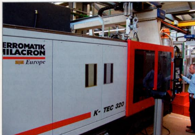
Spritzen von bis zu 4-Komponenten-Teilen.

In Breitenbach werden Produkte in Top-Niveau gefertigt. Als Komplettanbieter zählen neben der Verarbeitung verschiedenster Kunst-