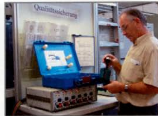
Qualitätskontrolle mittels Prüfteilen.

Biege-, Dreh- und Wickelteile werden in Eigenregie gefertigt. Damit ist eine perfekte Lösung aus einer Hand garantiert.