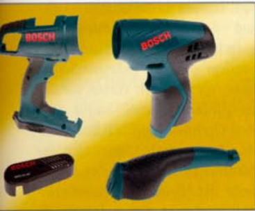
Kompetenz im Mehrkomponenten-Spritzguss.

Die Brac-Werke AG in Breitenbach übernimmt die Kunststoff-Fertigung von Bosch Scintilla.